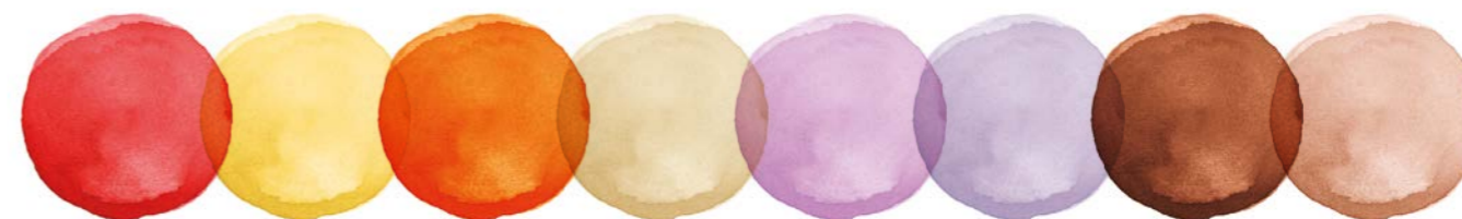
SCARLET SUN CORAL ALMOND ORCHID BLUEBERRY CHOCO CARMEL